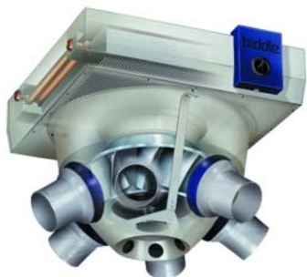
Ogrzewacz powietrza model NOZ

Przy magazynowaniu papieru należy zwracać baczność uwagę na wilgotność. Pomimo tego, że papier jest zawsze dobrze zapakowany, w przeszłości zdarzało się już, że najwyższe zwoje papieru były za bardzo ogrzane i wysuszone, a co za tym idzie – nieużyteczne. Dlatego właśnie papier wymaga przechowywania w dobrych warunkach.