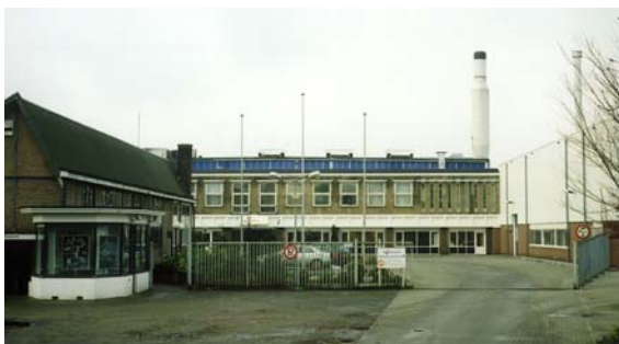
Budynek firmy Vaassen Flexible Packaging

Budynki przemysłowe są coraz lepiej izolowane, dzięki czemu potrzeba coraz mniej mocy grzewczej do zapewnienia odpowiedniej temperatury wewnątrz. Jednak kwestia dobrego rozprowadzenia powietrza pozostaje jak najbardziej nadal aktualna, jako że ciepłe powietrze musi zostać dobrze i równomiernie rozprowadzone wewnątrz. Ponadto coraz częściej stawia się wysokie wymagania dla komfortu i „elastycznego” podziału przestrzeni, a to z kolei wymaga „elastycznych” rozwiązań. Tradycyjne ogrzewacze powietrza najczęściej nie są w stanie sprostać temu zadaniu. Producent urządzeń w dziedzinie podziału i kontroli klimatów - Biddle z Kootstertille w Holandii - znalazł odpowiednie rozwiązanie: ogrzewacz powietrza z regulowanymi dyszami nawiewnymi. Z rozwiązania tego z powodzeniem korzysta między innymi firma VFP (Vaassen Flexible Packaging), producent „elastycznych” materiałów do opakowań. Ogrzewacze powietrza zapewniają odpowiedni klimat zwłaszcza w pomieszczeniu, gdzie magazynuje się papier.